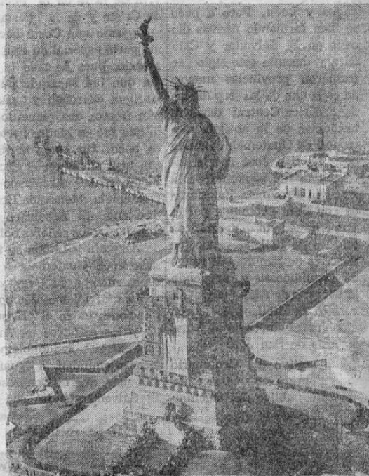
La estatua de la libertad

La Estatua de la Libertad Nuevamente consagrada Como un símbolo de libertad