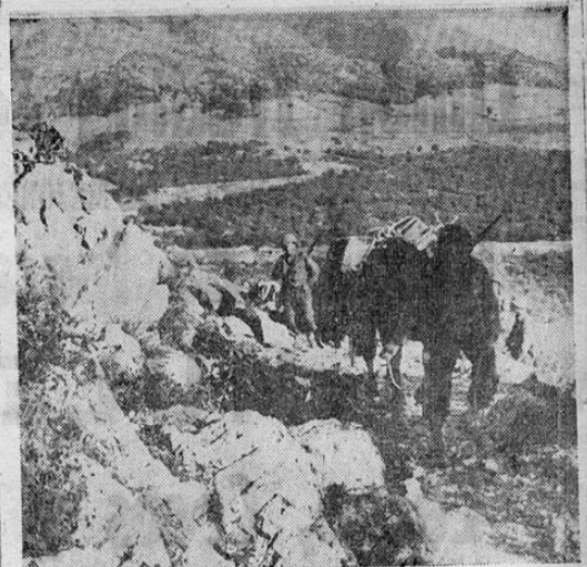
El terreno escabroso y los primitivos caminos y veredas en algunos sectores montañosos en el frente italiano, impiden el uso de unidades mecanizadas. Aquí vemos soldados norteamericanos haciendo uso de mulas para transportar víveres y pertrechos hacia las líneas de avanzada.